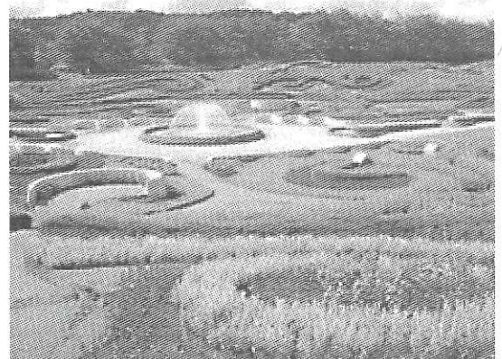
写真-1 彩の広場

この例に見られるように、初期の貯水池周辺環境保全対策は、自然環境の保全を意識しながらも、レクリエーション利用や乱開発の防止に焦点を当てたものが中心的であったと考えられる。その後も観光利用の要請から、ダム湖活用促進事業(レクリゾート事業)が創設されるなど、レクリエーション利用に重点を置いた対策が多く取られてきた。また、社会の環境への関心の高まりへの対応としては、主に水質保全の観点から、流入河川水