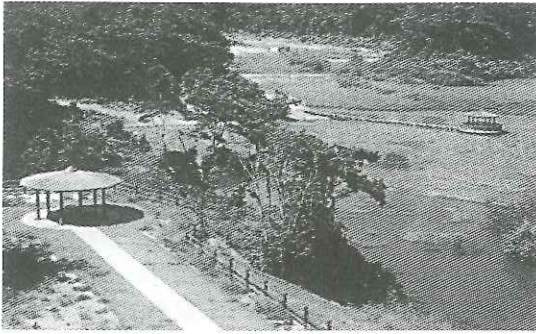
写真-2 漢那ダム第2貯水池