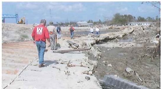
写真-12 円弧状に破壊変形したfloodwall

写真-16は上記地点から5km余東の地点で矢板部分が破壊されている事例である。この部分は左