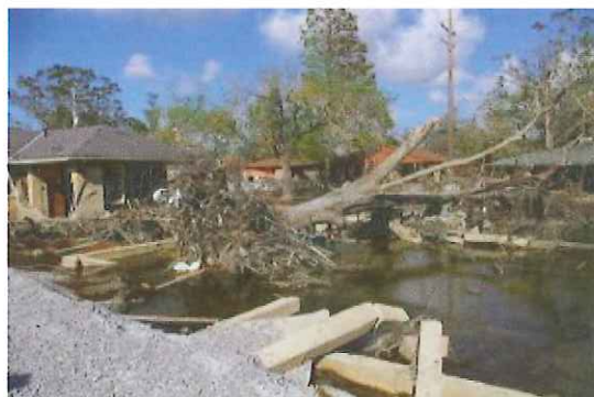
写真-7 南側破堤地点の被災状況