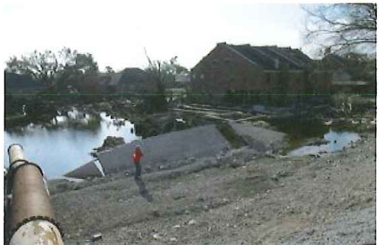
写真-3 破堤部堤内側の被災状況

写真-4は8月31日に撮影された北側の破堤地点の衛星画像である。Floodwallが堤内側に移動または傾倒しているのがわかる。破堤地点の堤内