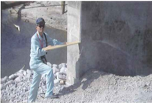
写真-10 コンクリートのfloodwallとそれより低かった道路との接続部の破堤状況