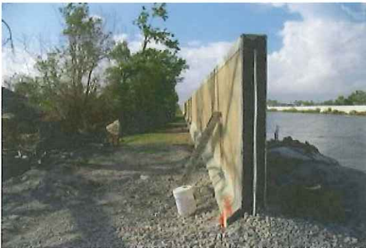
写真-1 破堤地点南側のI型 floodwall

図-1に今回調査を行った場所とその場所で高潮による越流越波の有無および破堤の状況を示す。背景画像の黒っぽい部分が浸水範囲である。ハリケーン「カトリーナ」はNew Orleansの約50km東方をほぼ南から北に進行した。カトリーナがNew Orleansの南方に位置していたときにハリケーンの反時計回りの風で引き起こされた高潮の影響を受け、東のBorgne湖で北のPontchartrain湖より大きな高潮が発生しており、これに接続するMississippi River Gulf Outlet Canal、Intercoastal Waterway、Industrial Canalの堤防で洗掘等のかんりの越流越波が発生した形跡が認められた。一方、Pontchartrain湖につながる17th Street CanalとLondon Ave. Canalでは破堤氾濫はあったものの越流した形跡は認められなかった。