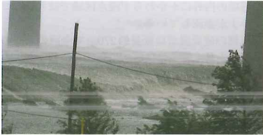
写真-14 Intercoastal Waterway aterway北岸堤防を越流する高潮