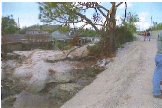
写真-5 北側破堤地点の被災状況と砂の堆積状況