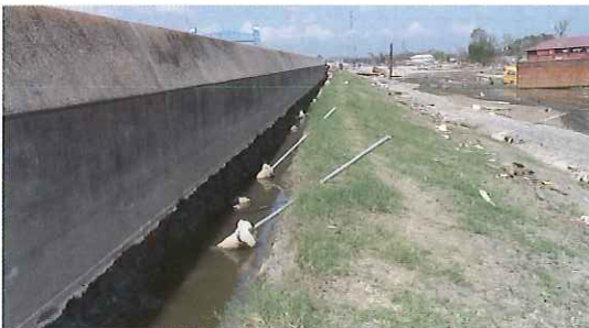
写真-11 コンクリートのfloodwall背後の洗掘状況