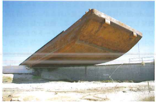
写真-17 堤防上に漂着したバージ