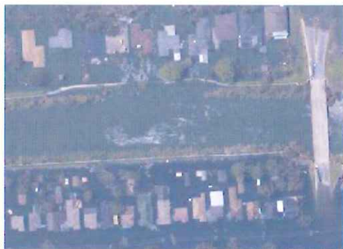
写真-4 北側左岸破堤地点のfloodwallの状況 (8月31日撮影のNOAAの衛星画像)

西側は港湾施設の背後にある二線堤で3カ所破堤している。ここから侵入した水は17th Street CanalやLondon Ave. Canalからの氾濫水と区別できず一体の浸水域となっている。矢板の上にI型のfloodwallが載る構造の二線堤は盛土部分が小規