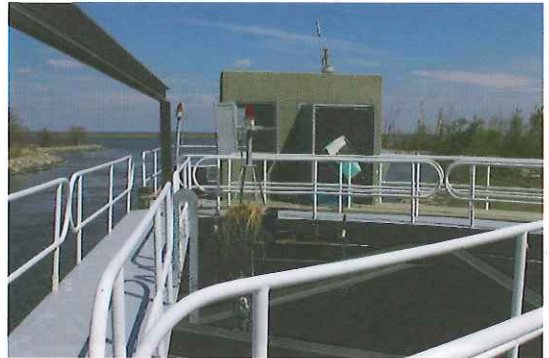
写真-18 Bayou Dupree Gateの損傷