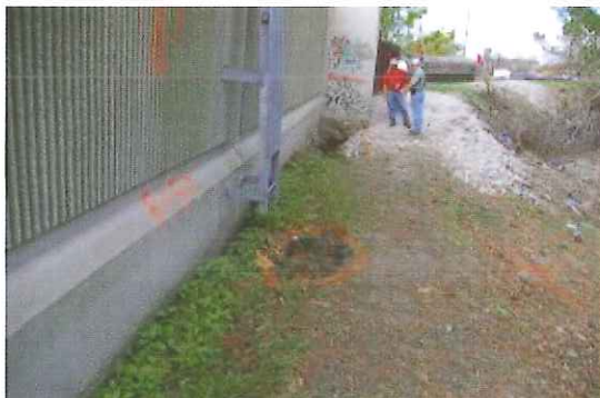
写真-6 傾いたfloodwallの堤内側に生じた陥没