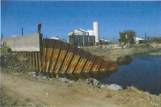
写真-16 構造物の高さが異なる部分での破堤

floodwallの高さが異なっている。左側のfloodwallの一部が破壊されているが、破堤には至っていない。このGateのすぐ南側で矢板が破壊し堤防の機能を全く失っているが、土堤は相当の越流越波を受けているにもかかわらず断面の部分的な欠損で済んでいるものが多い。