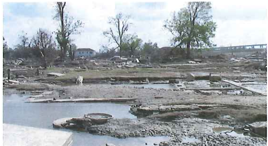
写真-13 破堤部分背後の住居跡