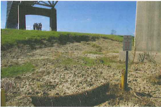
写真-15 越流により侵食された堤防裏法下部