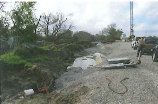
写真-2 水平に移動した堤防の一部と仮締め切り

17th Street CanalとLondon Ave. Canalは排水の用に供されており、橋の桁下高が低く、船舶の航行はできない。以下に箇所別に堤防を中心に被災状況を紹介する。