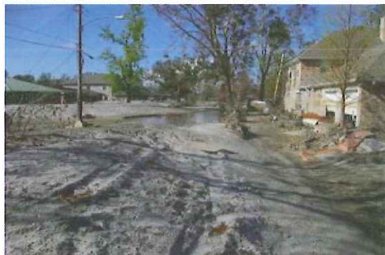
写真-8 南側破堤地点堤内側の砂の堆積状況