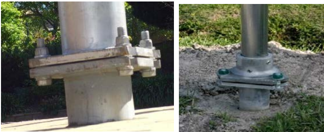
写真-1 柱の切断構造部分

大規模な施設を設置する路側余裕がないことも、両国間で規模に差が生じている一因として考えられる。