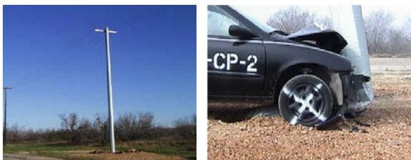
写真-2 電柱の衝撃緩和構造の例