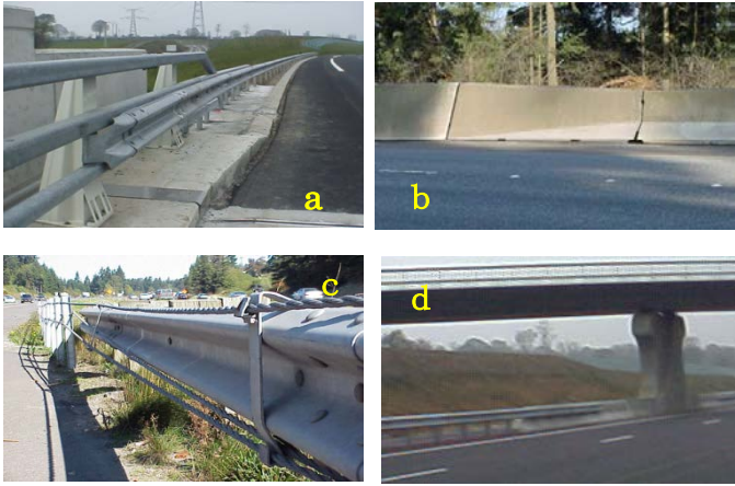
a. 橋梁防護柵とガードレール間 b. 形状の異なるコンクリート防護柵間 c. ガードレールとガードケーブル間 d. ガードレールとコンクリート防護柵間

等は、我が国では見ることのできない工夫がなされている。また、接続部についても、車両の安全性を確保するために評価を行うべき衝突条件が示されている（表-5）。