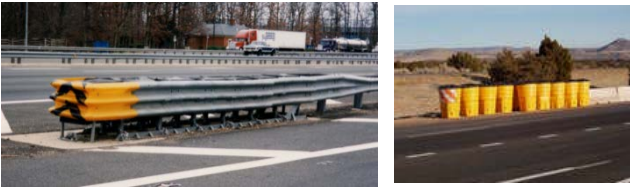
セルタイプ ドラムタイプ 写真-3 分岐部緩衝施設

具体的な構造例 7) と、車両衝突時の変形挙動を 図-2に示す。この施設の場合、表-2に示す衝突条 件で性能を満足するためには、8mに及ぶ緩衝長 が必要になっている。