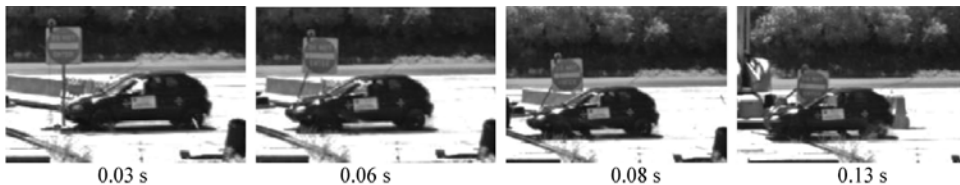
図-1 切断構造を有する標識柱への車両衝突