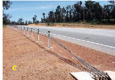
a. すりつけ構造 （ガードレール） b. 緩衝構造 （ガードレール） c. すりつけ構造 （ガードケーブル）