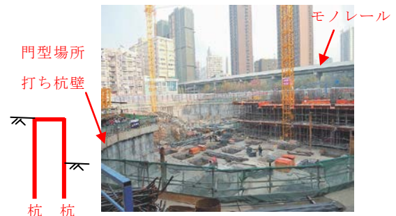
写真-4 門型柱列式連続壁（深さ11m、面積1.1万㎡）

土留め壁は柱列式地下連続壁、地下連壁（場所打ちコンクリート、泥水固化（SMW））等が主に使用されている。アンカー工が禁止されているため、写真-4のように土留め壁の剛性を増すため杭を2重に造り、その頭部を連結した門型の杭も用いられている。