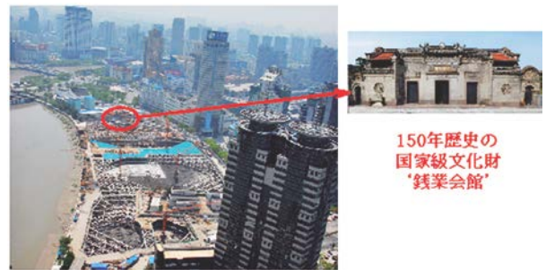
写真-9 文化財の保全