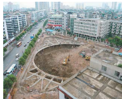
写真-5 柱列式連続壁+切梁（深さ10.5m、面積5千㎡）

また、掘削面積が大規模な場合、掘削面積を広く取るため写真-5や図-2に示すような土留め壁に作用する土圧を中央のリングで均等配分した切梁支保工も使用されている。