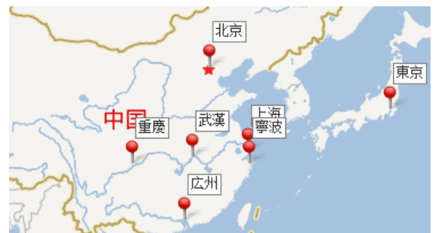
図-1 武漢市と寧波市の位置

このような社会基盤の急速な整備に様々な問題が生じている。特に、大都市内においては地上に加え、地下空間の高度利用が進められ、その結果、輻輳する地下施設の間を縫っての整備となり、軟弱な地盤条件に加え、将来の地下空間の開発に備え、アンカー工による土留め工の禁止など厳しい建築制限の適用がなされている。このため大規模な地下開発に必要な土留め工の選定に厳しい制限が課せられ、昨今では、都市開発の中で土留め工が最も重要なプロジェクト案件となっている。