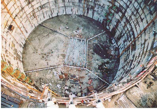
写真-6 長江大橋の立坑（連壁内径70m，深さ60m）