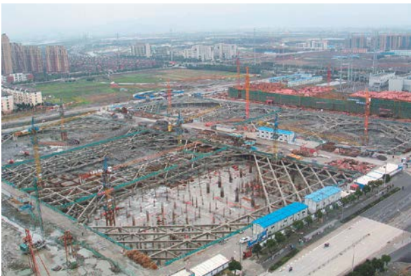
写真-7 20個立坑群の一部（地下2階，総面積35万㎡）

寧波市は長江デルタの上にあるため、地盤は高含水比、低強度、高圧縮性でかつ、難透水の極軟弱な沖積層で、その深さは40mまで続き、支持層は60mで深となる。この状況は佐賀低平地の軟弱地盤に類似している。寧波市でも、都市の再開発が活発に進められ、写真-7の20個の立坑からなる総掘削面積35万㎡の商業センターや掘削面積4.5万㎡、掘削深さ17~24mの金融センターの建設が進められている。また、寧波市では、長い歴史を有するために文化財も多く、写真-9のように地下空間開削においても、その保全が重要な課題となっている。