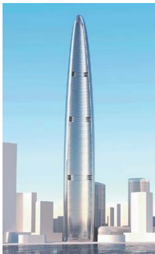
写真-3 建設中の武漢緑地中心ビル（高さ606m）

武漢市においても、写真-3に示す超高層建築や長江の渡河橋（長江大橋）をはじめ、都市の再開発が活発に進められ、その結果、大規模な土留め工事は2012年で410件を超えている。これらの工事の中には、掘削深さでは地下6階（5.0～30.4m）となる建築ビルの地下立坑や、掘削深さが60mとなる長江大橋の基礎の立坑などもある。また、掘削面積では10,000㎡を超えるものも少なくない。