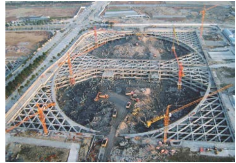
写真-8 金融中心（深さ17~24m，面積4.5万㎡）

2007年12月開通した陽邏長江大橋の基礎の立坑は、写真-6のように内径70m、深さ60mの大深度・大規模な円形の地下連壁を採用された。