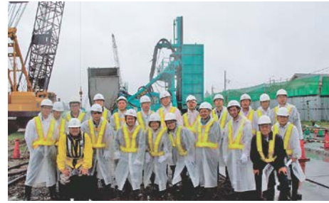
写真-14 現地見学の参加者

建設に当たっては、品質の確保と環境に優しい道づくりを目指し、様々な土留め工法や地下水制御などの検討・工夫をしていた。例えば、泥水固化方式のソイルセメント連続壁工事において流動化剤を添加することでセメントミルクの注入量を大幅に抑制し、廃棄する建設泥土の量を大幅低減する工法が用いられていた。また、地下水流の阻害対策としては浅層部では透水層に井戸を設置して集水し、集めた水は通水管で導き、復水井戸で