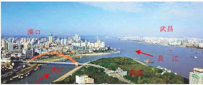
写真-2 武漢三鎮および長江と漢江との合流点

漢三鎮」と呼ばれ、漢口、漢陽、武昌の三つの都市からなっている。また、武漢市は中部長江と京広線（北京～広州）の水陸交通大動脈の結末点で東に上海、西に重慶、南に広州、北に北京といずれも1,000kmの距離に位置し、物流の要として重要な役割を果たしている。