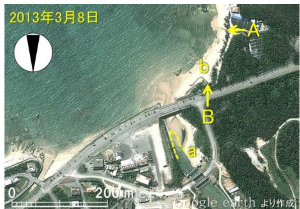
図-4 漢那福地川河口の衛星画像（2013年3月8日）