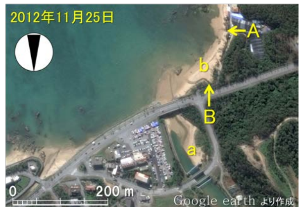
図-3 漢那福地川河口の衛星画像（2012年11月25日）