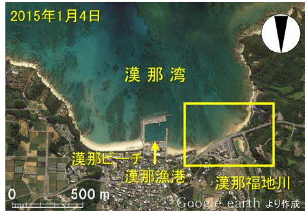
図-1 漢那湾に流入する漢那福地川周辺の衛星画像

調査対象の漢那福地川は、流路延長4.65km、流域面積9.0km 2 の二級河川で、河口から1.1km上流には漢那ダムがあり、ダム直下まで海水が遡上する条件を有している。このため河川流出土砂量は小さい。なお、漢那ダムからの維持流量は0.0347m 3 /sとされており、自己流量により河口砂州がフラッシュするには流量規模が小さい。河口付近には干潟や湿地があり、旧漢那橋より上流にはマングローブが生育しているが、河口閉塞に伴う淡水化によりマングローブの枯れ死 5) も起きている。