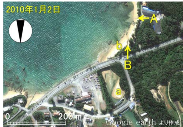
図-2 漢那福地川河口の衛星画像（2010年1月2日）

以上のように、漢那福地川の河口部では河口閉塞が進んだことから、対策としての掘削が行われてきた。一方、海浜部に流入する排水路Aでは上記4時期とも河口沖に土砂が堆積していることが特徴として指摘できる。河口右岸側の海岸線は河口へ向かって斜めに張り出しており、全体に大きく湾曲している。湾内へと進む波は、この湾曲した汀線への法線に対し右回りの方向からの斜め入射となるため、海岸線に沿って河口へと向かう沿岸漂砂が起こる条件となっており、漂砂上手側に位置する排水路Aより土砂流入があるため、流入土砂が漢那福地川河口右岸へと運ばれ、河道内を上流へと遡って砂州を形