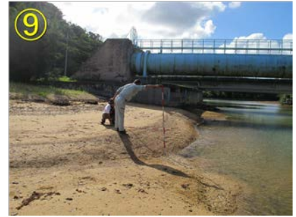
写真-2 漢那福地川の河口状況 (⑦～⑨)

ように浚渫土砂による盛り土がなされていたが、盛り土ののり先は満潮時の侵入波浪により侵食され、小規模な浜崖が形成されていた。この付近から削り取られた砂は上流方向へ運ばれ、やがて河道を横断する方向に堆積する。右岸に沿ってさらに上流へと遡ると、水管橋の袂では右岸に沿って波の作用で運び込まれた砂が橋台で阻止され、その下流側に砂州を形成していた（写真-1⑨）。この砂州においても河道内に砂が落ち込んだため急勾配斜面が形成されていた。