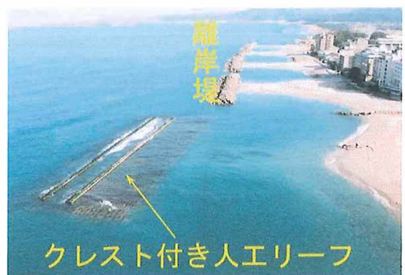
図-2 人工リーフと離岸堤（皆生海岸）