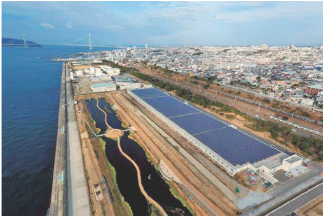
図-5 こうべWエコ発電プロジェクト（太陽光発電）

れら双方の強みを生かすことで、市が直接、発電・売電するよりも事業性を高めている。