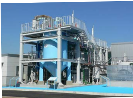
図-3 リン(MAP)回収実証設備

本市は、平成24年度のB-DASHプロジェクトに、「神戸市東灘処理場 栄養塩除去と資源再生(リン) 革新的技術実証事業 - KOBEハーベスト(大収穫)プロジェクト -」を提案のうえ採択され、平成25年度にかけて国総研の委託研究として実施している。