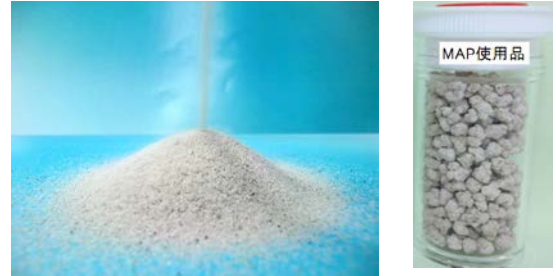
図-4 回収MAP(左)とMAPを使用した試作肥料