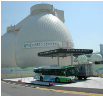
図-2 「こうべバイオガス」自動車燃料

「こうべバイオガス」は人類が生存する限り枯渇することのないエネルギーであり、「こうべバイオガス」を燃料として走行する車両のCO 2 排出量は0（ゼロ）となる。