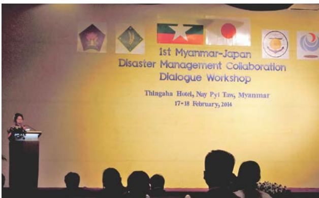
図-6 第1回日・ミャンマー防災協働対話ワークショップ

度重なる自然災害を経験してきた我が国は、災害を克服するために蓄積した技術や経験を、世界の国々と共有することで、各国の防災、減災対策がより強化されるよう、取組む必要があると考えている。そのための取組みの1つとして国土交通省は「防災協働対話」を進めている。「防災協働対話」は、防災面での課題を抱えた国に対して、両国の産学官で連携し、平常時から防災分野の二国間協力関係を強化する取組みである。最近では2014年2月にミャンマーで開催された第1回日・ミャンマー防災協働対話ワークショップにおいて、国土交通大臣とミャンマーの防災関係3大臣との間で、防災協働対話の枠組みに関する覚書を交わし、当該分野における協力関係の更なる発展を目指すことで一致した 3) (図-6)。水関連災害の常襲国であるアジアをはじめとした途上国との防災協働対話により、我が国の技術、経験が対象国の課題解決に資するよう産学官が連携して協力を促進したいと考えている。