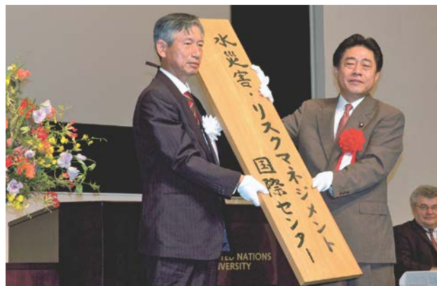
図-1 ICHARM設立記念シンポジウム(2006年9月14日 国土交通大臣揮毫の看板が土木研究所理事長に手渡される)

世界中で増え続け深刻化する水関連災害に対応するため、国際連合(国連)及びユネスコは国際自然災害軽減10年や国連国際防災戦略(UN/ISDR)、世界水アセスメント計画などの活動を行ってきた。さらに2002年にはユネスコと世界気象機関(WMO)により国際洪水イニシアチブ(IFI)の準備活動が開始され、2005年に国連大学やUN/ISDRの参画の下で公式に発足が宣言されるなど、国連及びユネスコは水関連災害の解決のために常に指導的役割を果たしてきた。こうした背景の下、日本政府の提案で2006年3月にユネスコのカテゴリー2センター(C2C)として独立行政法人土木研究所内にICHARMが設立された(図-1)。なお、C2Cとは、ユネスコ総会決議を経て、ユネスコの世界的活動展開の強化に資する機関として認定された組織を指す。