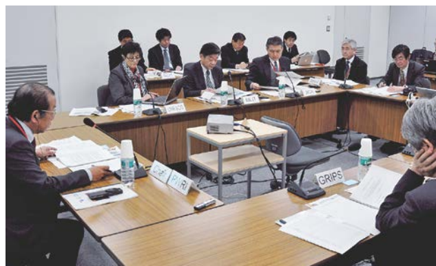
図-5 第1回運営理事会

新協定に基づく運営理事会の第1回会合は2014年2月25日に東京で開催され、日本政府からは国土交通省技監が出席している(図-5)。設立以来、研究・研修・情報ネットワークの3本柱で活動を進めてきたICCHARMとして、今後の10年及び5年程度を見据えた長期的及び中期的プログラム、2014年度及び2015年度の活動内容を記した活動計画が採択された。「国際から国家、地域レベルで水関連災害・リスクマネジメントに携わる政府とあらゆる関係者を支援するために、自然・社会現象の観測・分析、手法・手段の開発、能力育成、知的ネットワーク、教訓・情報の発信等を通じて、水関連災害・リスクマネジメントにおける世界的な拠点としての役割を果たす」という使命の下、革新的な研究、効果的な能力育成及び効率的な情報ネットワークの各活動内容が長期的及び中期的プログラムとして記載されている。特に水関連災害として、渇水災害や津波・高潮災害、雪氷災害等にも対象を広げていること、基盤となる水文観測技術の開発を重視していること、能力育成のための研修活動と研究を有機的に結び付けて現地での実践を効果的に実施すること、世界の大規模水災害に関する情報・経験を「災害情報の総合ナレッジセンター」として蓄積することが明記されており、現場での実務を重視し、具体的な問題解決を目指している点で注目される。