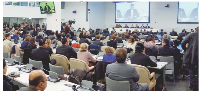
図-3 国連「水と災害に関する特別会合」

取り組み、2011年には第5回洪水管理国際会議(ICFM5)および水災害フォーラムをハイレベルな参加を得て主催し、2012年は国際洪水イニシアチブ(IFI)事務局として「国連気候変動に対する枠組み会議(Framework Convention on Climate Change: FCCC)」やRio+20、さらには水と災害に関するハイレベル専門家パネルのメンバーとして、2013年3月6日に国連により開催された「水と災害に関する特別会合」にも貢献している(図-3)。