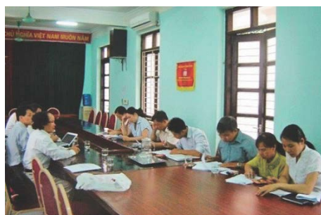
図-2 ベトナムにおける調査の様子

用いて評価される。この評価指標得点が高いほど準備体制力が高いことを示すものとし、最小値は1、最大値は10である。算出された得点は、各主指標を軸とした8角形のダイアグラムを用いて表すことで、各コミュニティの問題点を簡単に把握できるよう工夫した 9),10),11) 。