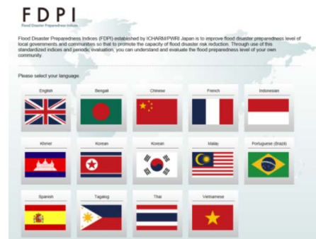
図-3 多言語ウェブサイトのトップページ

診断結果は、八角形のダイアグラムとともに、集計された各主指標の得点と未回答の設問番号が示される(図-4)。さらに、地域コミュニティにおける今後の洪水準備体制充実への手助けとなるよう、評価指標得点に合わせたコメントを掲載したマトリックスも同時に表示させるようにした。また、回答結果は自動的に著者らに送信され、各地域コミュニティでどのような状況にあるのか、データも収集できるような仕様とした。